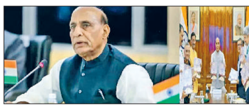
नौसेना के लिए खरीदे जाएंगे बंदूक, टॉपपीडो

डीएसी ने नौसेना के लिए जिन रक्षा खरीद प्रस्तावों को मंजूरी प्रदान की है। उनमें लैंडिंग प्लेटफॉर्म डॉक्ट्स (एलपीडी), 30 मिमी नेवल सरफेस गन (एनएसजी), उन्नत हल्के मार वाले टॉपपीडो (एएलडब्ल्यूटी), इलेक्ट्रो ऑप्टिकल इन्फ्रारेड सर्च एंड ट्रैक सिस्टम और 76 मिमी सुपर रेंजिड गन माउंट के लिए स्मार्ट गोला बारूद की खरीद के लिए एओएन दिया गया है। एलपीडी की खरीद नौसेना को बाकी दो अन्य सेनाओं के साथ जल-थलवर